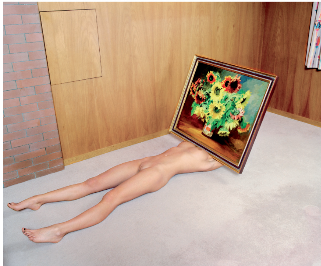
ouncement (Oznámení), pro Friday Magazine, 2009